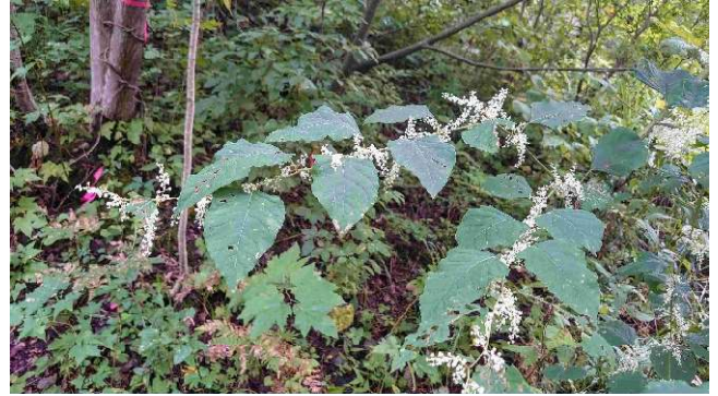
m DSC_3716 イタドリ R05.09.23AM0716 S.jpg