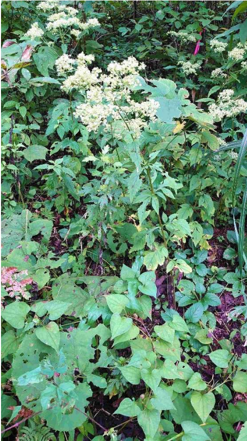
m DSC_3711 オトコエシ R05.09.23AM0715 S.jpg